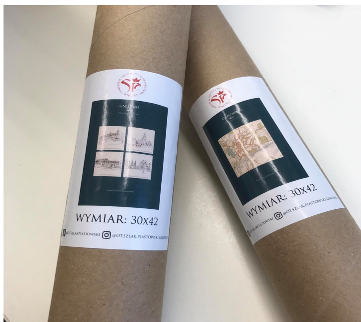
Zdj. Plakat mapy Gniezna

W tym samym czasie OT „Szlak Piastowski” dzięki zgodzie od Archiwum Państwowego w Poznaniu, Oddział w Gnieźnie powstał kolejny plakat tym razem z planem miasta Gniezna z roku 1927 również pakowane w tubę ekologiczną.