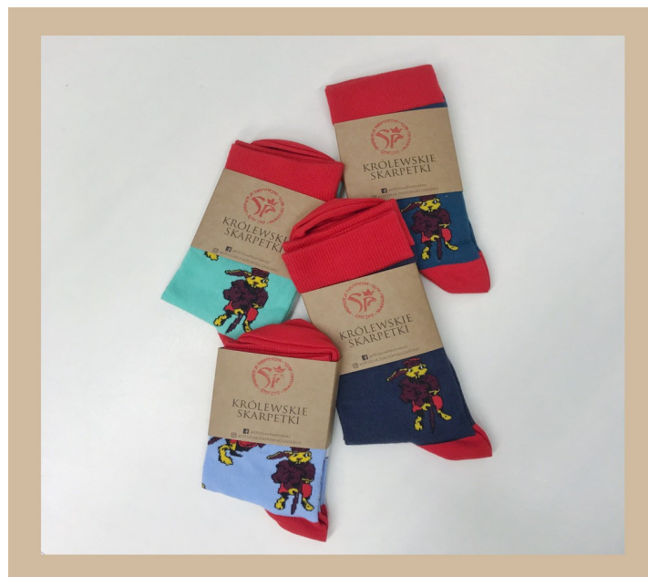
Zdj. Królewskie skarpetki