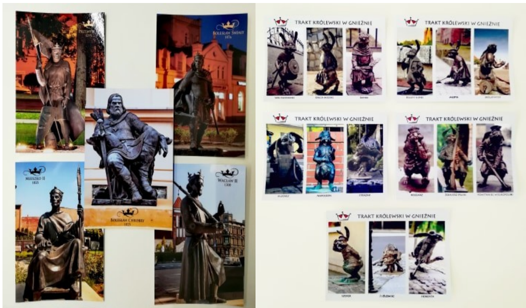
Zdj. Widokówek Traktu Królewskiego

Królewskiego (w sumie 12 rodzajów pocztówek z Traktu Królewskiego: 5 pocztówek z królami, 5 pocztówek z królikami oraz 2 pocztówki z Legendami) oraz personalizowane skarpetki pakowane w ekologiczną obwolutę (aktualnie dostępne w 4 rozmiarach od 34 do 43, w różnych kolorach). Cały czas, pomimo zaburzeń w ruchu turystycznym nie zwalniamy tempa i w trakcie opracowywane są kolejne skarpetki z pozostałymi królikami.