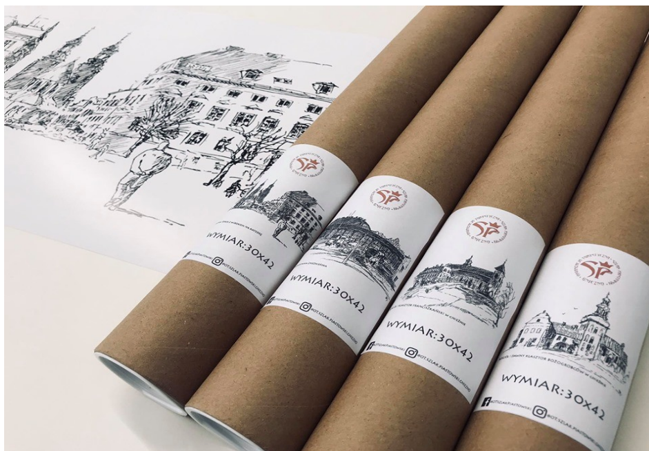
Zdj. Plakaty M. Derengowskiego

W tym samym czasie OT „Szlak Piastowski” dzięki zgodzie od Archiwum Państwowego w Poznaniu, Oddział w Gnieźnie powstał kolejny plakat tym razem z planem miasta Gniezna z roku 1927 również pakowane w tubę ekologiczną.